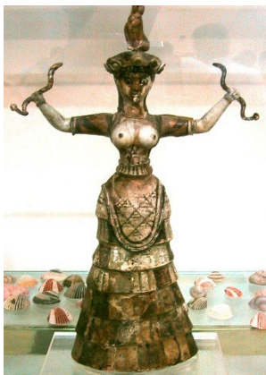
La dea dei serpenti (Creta, II millennio a.C.)

Emerge poi importante il tema della sorellanza tra donne che vivono in epoche diverse, ma che si aiutano attivamente, curano e si prendono cura: Altha e sua madre conoscono le erbe, accudiscono i malati, sono le ostetriche nel paese. La solidarietà è l’altra via per assistere: Altha protegge l’amica, mentre Violet lascia in eredità il cottage a Kate per fornirle un rifugio che sa le servirà... Kate fugge per salvare sé stessa, ma anche per proteggere la figlia di cui è in attesa.